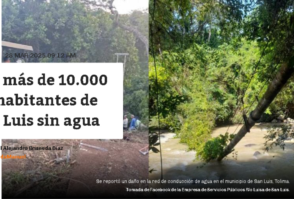
Se reportó un daño en la red de conducción de agua en el municipio de San Luis, Tolima.

Por: Manuel Alejandro Brisneda Díaz @BrisnedaManuel