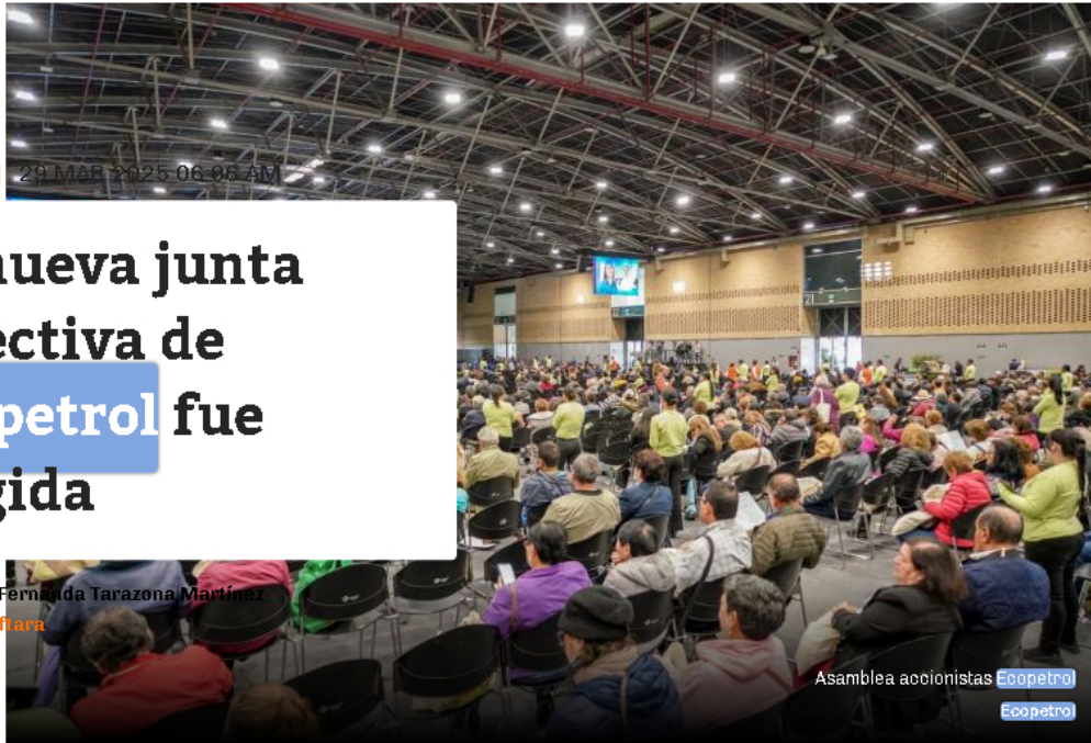
Asamblea accionistas Ecopetrol