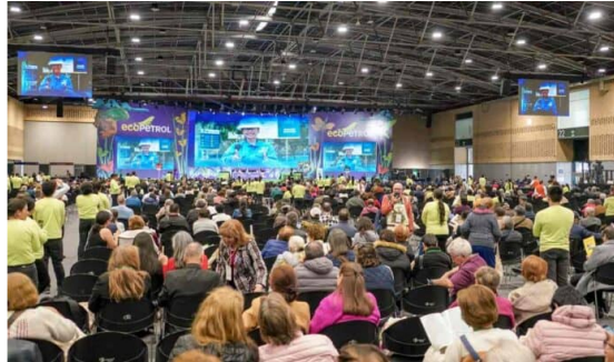
Se aprobaron ajustes para el reglamento interno de la Asamblea de Accionistas de Ecopetrol

La Asamblea General de Accionistas de Ecopetrol aprobó la propuesta de la Junta Directiva para la hacer una modificación al reglamento interno de la Asamblea General de Accionistas. ¿Cuáles son los cambios?