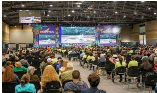
Ecopetrol tendrá Asamblea Extraordinaria para evaluar la inclusión de un trabajador en la Junta Directiva

En la Asamblea General de Accionistas de Ecopetrol se aprobó este viernes (28 de marzo de 2025) que cite a una Asamblea Extraordinaria para estudiar la propuesta de incluir a un trabajador de la petrolera dentro de la Junta Directiva.