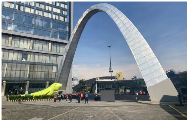
Asamblea de accionistas de Ecopetrol 2025 | Foto: Martha Morales Manchego / Semana