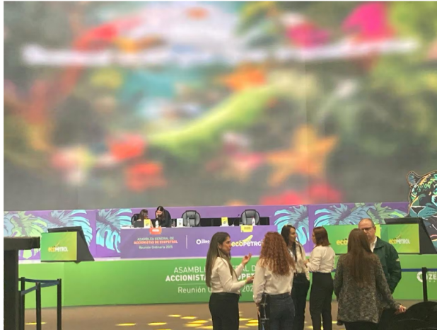
Asamblea de Ecopetrol 2025 | Foto: Martha Morales Manchego / Semana

"Así murió Maradona": juicio por muerte del argentino arrancó con una foto inédita