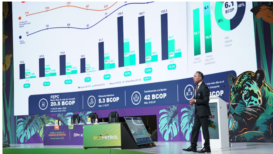
Asamblea de accionistas de Ecopetrol 2025

Una propuesta inesperada, de parte del Ministerio de Hacienda, como representante del Estado, que es el dueño mayoritario de Ecopetrol, llegó a la mesa principal de la asamblea de accionistas de la petrolera.