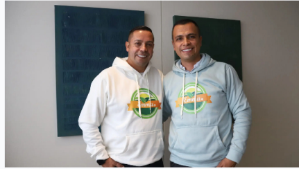
Forbes Live - Eventos Forbes

Emma, la revolución AgroTech que está transformando el campo colombiano