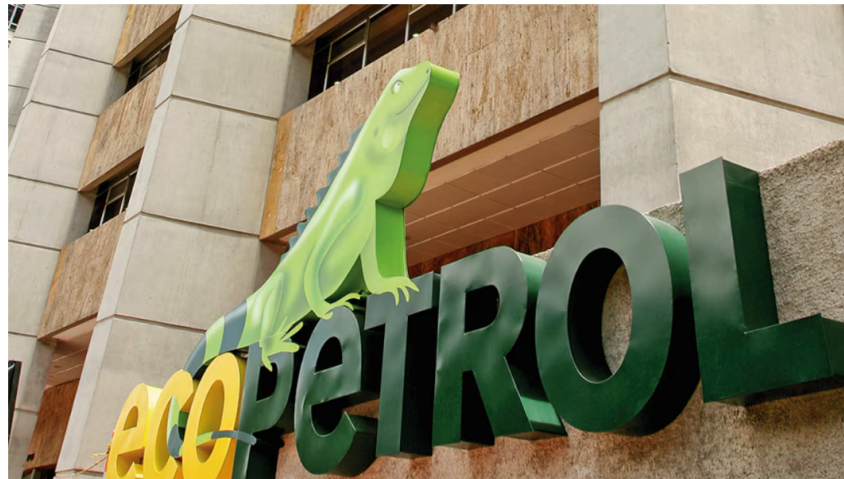
Dividendo que Ecopetrol pagará en 2025 a sus accionistas.

28 de marzo de 2025 Por: Redacción El País