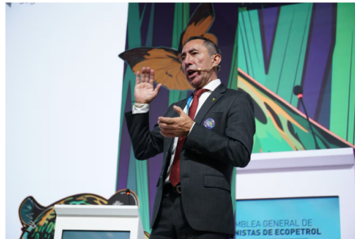
El presidente de Ecopetrol, Ricardo Roa, aseguró que la filial es uno de los activos más valiosos de la petrolera. | Foto: Suministrado por prensa Ecopetrol

Mientras que para el accionista mayoritario, Gobierno nacional, que posee el 88,5 % de la participación en la compañía, será en 3 cuotas: el 4 de abril (en total $2,2 billones), el 29 abril ($2,3 billones), y el 27 de junio de 2025 ($3,2 billones).