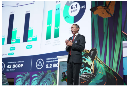
Ricardo Roa, presidente de Ecopetrol presentó informe a la Asamblea de Accionistas.

Durante su intervención, Roa anotó que las próximas inversiones de la empresa estarán enfocadas en proyectos de gas. "El objetivo de diversificar las operaciones de la empresa y fortalecer su posicionamiento en este sector clave para la sostenibilidad energética del país".