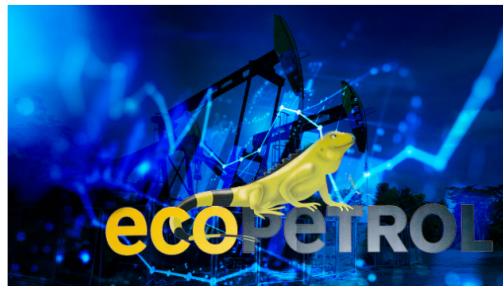
La petrolera distribuirá $25,4 billones en dividendos, pese a una reducción del 21,9% en sus utilidades.

Este monto representa el 58,9% de la utilidad neta obtenida por la compañía durante 2024 ($14,9 billones), con una caída del 21,7% en comparación con lo reportado en el año 2023, cuando fueron por el orden de $19 billones.