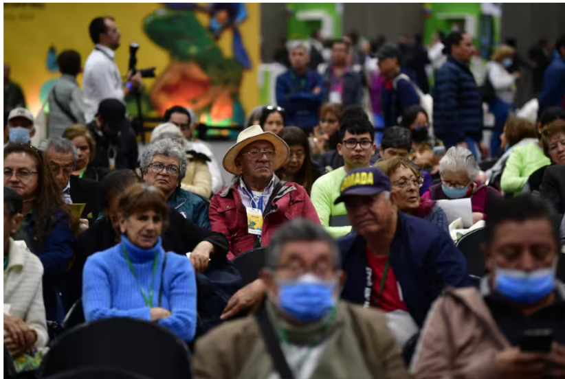
Asamblea de accionistas de Ecopetrol