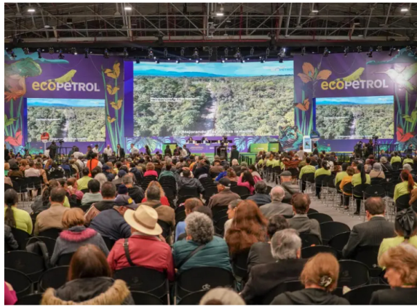
La Asamblea General de Accionistas se realiza en Corferias.

Entre otros puntos, se elegirá a los miembros de la nueva junta directiva de la petrolera.