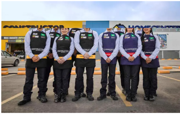
Homecenter cuenta con más de 9.000 colaboradores a nivel nacional.

Entre los beneficios ofrecidos por la compañía están trabajar en buen ambiente laboral, brindando oportunidades de crecimiento y desarrollo profesional.