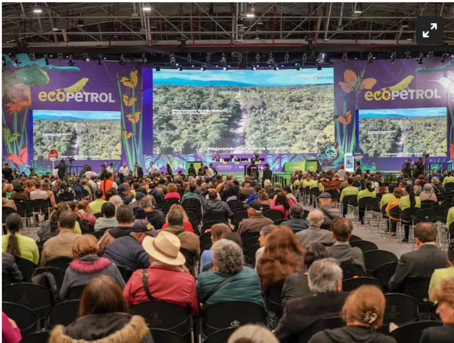
Asamblea de Accionistas de Ecopetrol