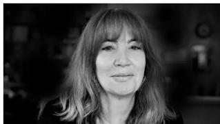
Anatomía de una caída y el factor Benedetti Cambio Colombia