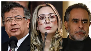
Gustavo Petro crítica a Katherine Miranda por 'traición' tras filtración de chat con Benedetti Cambio Colombia