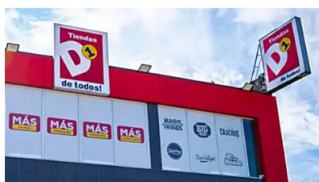
Tiendas D1 toma drástica medida ante escándalo por lactosueros Cambio Colombia