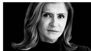
La encrucijada de Susana Muhamad Cambio Colombia