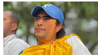
Caso Nicolás Petro: Fiscalía finaliza descubrimiento probatorio y se prepara para juicio Cambio Colombia