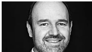
El fraude bancario del que escapé dos veces Cambio Colombia