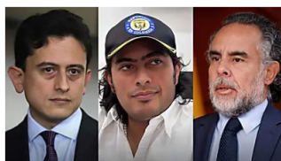
Detalles sobre las recomendaciones de Benedetti para la Dian y su encuentro con Nicolás Petro Cambio Colombia