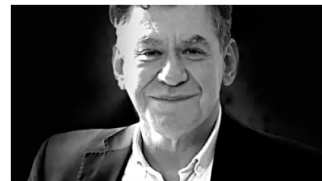
El ocaso de Uribe Cambio Colombia