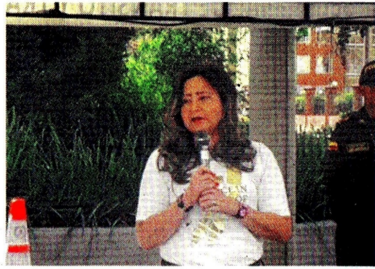
La FM de RCN

La ministra de Transporte , María Fernanda Rojas , abrió un espacio para comentarios sobre la modificación del Decreto 1079 de 2015, que regula el transporte de carga. Esta iniciativa responde a los acuerdos establecidos en septiembre de 2024, con el objetivo de reducir desigualdades en relaciones económicas. Entre los cambios proponen medidas para facilitar la habilitación de pequeños transportadores. (ID)