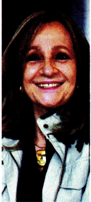
Ángela María Robledo

Independiente Miembro desde marzo de 2024.