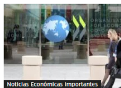
Noticias Económicas Importantes

Producción de hidrógeno en Colombia creció 12 veces entre 2023 y 2024