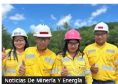
Noticias De Minería Y Energía

Correjón reducirá producción de carbón térmico en Colombia: bajará entre 5 y 10 millones de toneladas