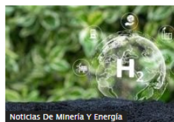
Noticias De Minería Y Energía

Correjón reducirá producción de carbón térmico en Colombia: bajará entre 5 y 10 millones de toneladas