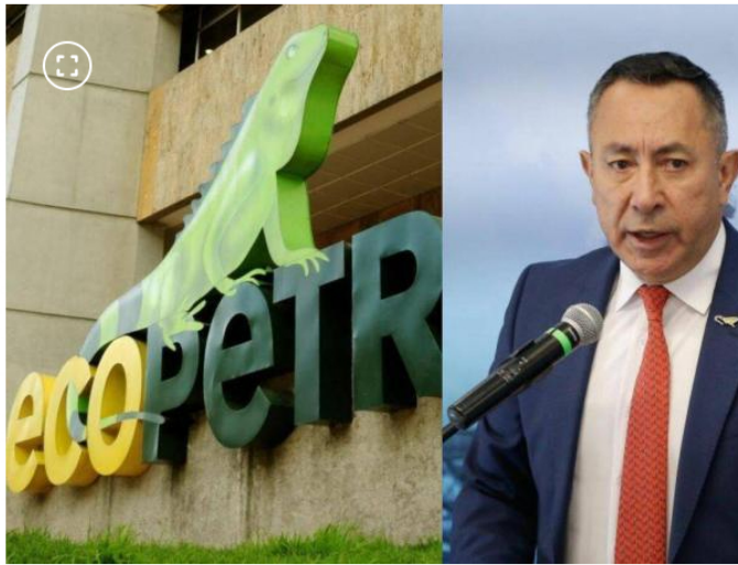
Ricardo Roa, presidente de Ecopetrol .

azufre (SOx) y el monóxido de carbono (CO) en unas 90.000 toneladas al año; lo que equivale al 2,7 por ciento de las emisiones de estos agentes, cuya reducción es fundamental para mejorar la calidad del aire y la salud de los colombianos.