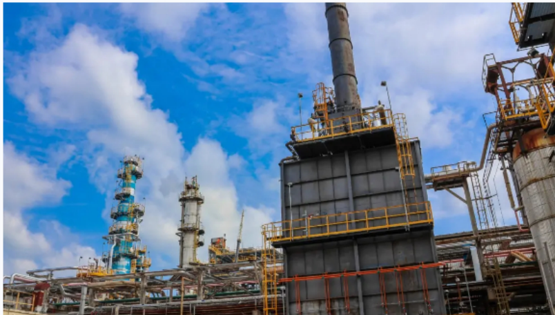
La refinería de Barrancabermeja, que hoy celebra 103 años de operaciones, es el centro de refinación y petroquímica más importante del país.

Forbes Staff | marzo 25, 2025 @ 6:18:40 am