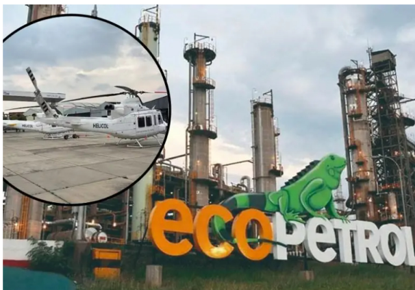
Helicol denuncia un entramado de posibles irregularidades en la adjudicación de contratos de transporte aéreo por Ecopetrol.

Desde 2011, Ecopetrol ha favorecido a Helistar en contratos aéreos. Helicol intentó competir en 2024, pero enfrentó trabas y una abrupta terminación. ¿Solo un "contentillo" antes de devolver todo a la competencia?