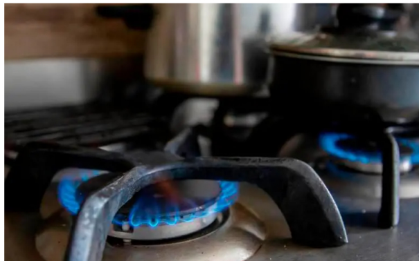
Colombia se enfrenta a un desafío energético sin precedentes. La clave estará en equilibrar la transición hacia energías limpias sin descuidar la seguridad energética del país.

El déficit de gas natural en Colombia amenaza con disparar los costos energéticos. Fitch Ratings advierte sobre el impacto de la creciente dependencia de importaciones.