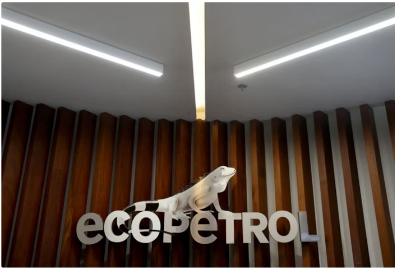
Ecopetrol refuerza su presencia en aguas profundas con la aprobación del proyecto Gato do Mato en Brasil

Ecopetrol sigue expandiendo su presencia en el mercado energético internacional y, en esta ocasión, dio un paso estratégico en Brasil con su participación en el proyecto Gato do Mato. Este desarrollo offshore, ubicado en la Cuenca de Santos, fue catalogado como un descubrimiento de gas condensado en aguas profundas, con profundidades que oscilan entre los 1.750 y 2.050 metros.