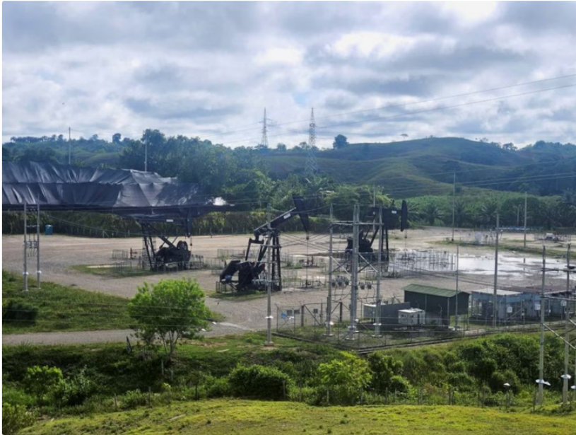
Shell, Ecopetrol y Total Energies lideran un consorcio para desarrollar 370 millones de barriles en la Cuenca de Santos

El plan de desarrollo del proyecto contempla la instalación de una unidad flotante de producción, almacenamiento y descarga (FPSO), diseñada con capacidad para procesar hasta 120.000 barriles de petróleo por día. Se estima que el volumen de recursos recuperables del proyecto ascienda a 370 millones de barriles brutos, de los cuales Ecopetrol podrá disponer del 30%. Se prevé que la producción inicie en 2029, incorporando reservas significativas a partir de 2025.