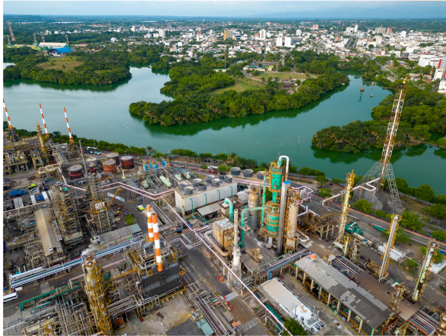
Refinería Barrancabermeja Ecopetrol, en Santander, Colombia.