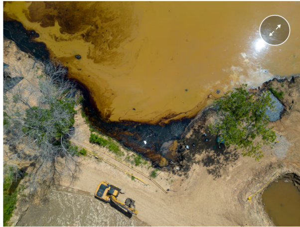
Vista aérea de la contaminación del agua de los humedales del Magdalena, cerca a la ciudad de Barrancabermeja.