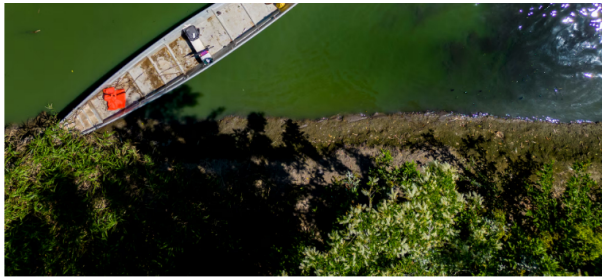
Contaminación en el agua en humedales cercanos a la refinería de Barrancabermeja. EIA

EIA, por su lado, se alió con investigadores de la Facultad de Ciencias Farmacéuticas de la Universidad de Cartagena para hacer un análisis toxicológico del agua en las zonas mencionadas por Olarte. Encontró, cuenta un informe, “elementos altamente tóxicos, entre ellos hidrocarburos aromáticos policíclicos y metales pesados”. La BBC, por su lado, viajó a una de las áreas marcadas como contaminadas en la base de datos de los Iguana Papers , y entrevistó a un grupo de pescadores que mide, con ayuda del estatal Instituto Humboldt, esos mismos metales pesados. “En estos momentos, aquí en Caño Rosario, está realmente dentro de los metales pesados, están bastante alterados”, le dice a la BBC una de las pescadoras, mirando unas tiras que se marcan de colores ante la presencia de esos materiales. La única fuente cercana de esos metales es Ecopetrol.