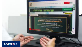
Resultado de la Lotería de Risaralda HOY 21 de marzo 2025: números ganadores