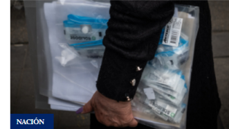
Audifarma se refirió a la inspección de Supersalud en bodega