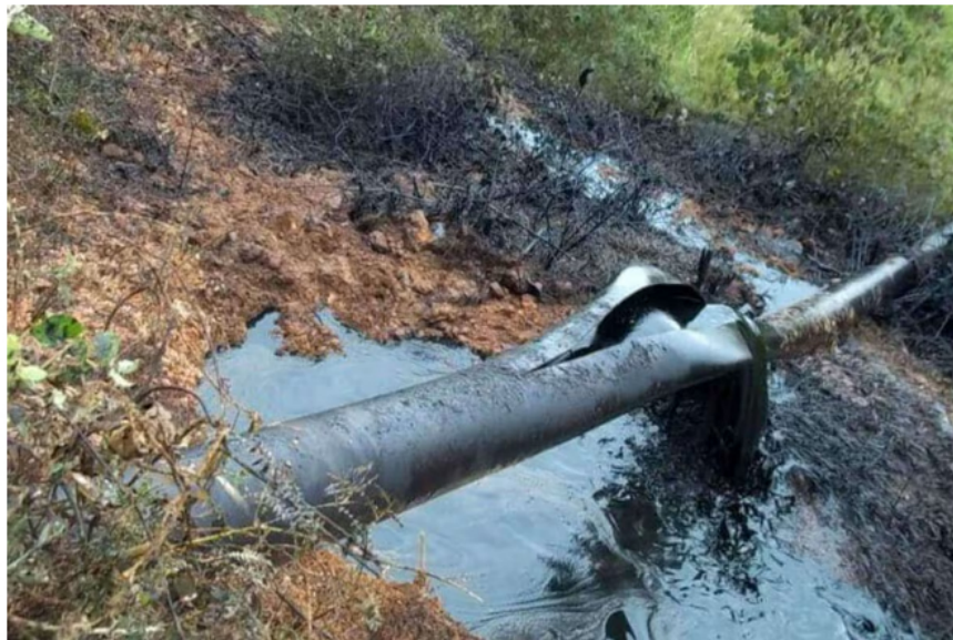
Atentados contra los oleoductos Bicentenario y Caño Limón-Coveñas, en el departamento de Arauca.