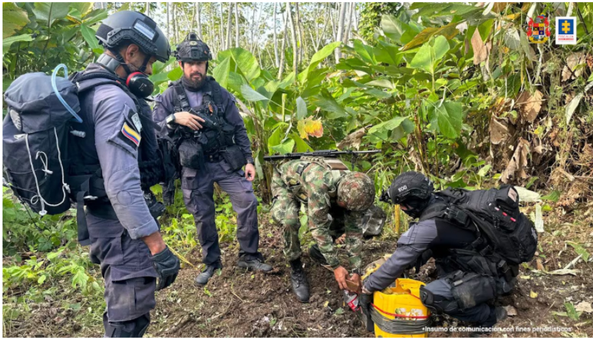
El Ejército Nacional ya se encuentra en la zona asegurando el área. (Imagen de referencia).

Este ataque a la infraestructura de transporte de hidrocarburos se produce en un contexto de creciente preocupación por los actos violentos en el departamento de Arauca, que han afectado diversas actividades productivas y la seguridad de los habitantes.