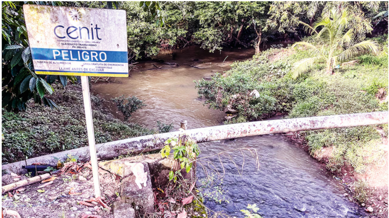
El Ejército Nacional ya se encuentra en la zona asegurando el área. (Imagen de referencia).

Arauca vivió una nueva jornada de violencia, este miércoles, 19 de marzo, cuando dos atentados terroristas afectaron la infraestructura petrolera en el departamento. Las autoridades investigan los hechos.