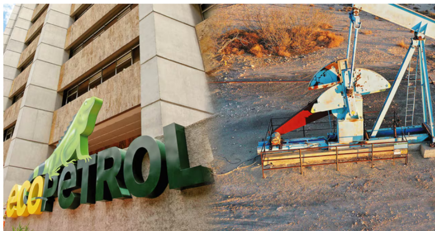
Ecopetrol aún no ha reaccionado oficialmente al artículo de la BBC.

"La compañía obtuvo la Calificación A-, que la ubica en el nivel de Liderazgo más alto de la evaluación de desempeño en seguridad hídrica, gracias a sus procedimientos en reporte de métricas, evaluación de dependencias, impactos, riesgos y oportunidades asociadas al agua, políticas ambientales y de gobernanza, y su hoja de ruta para alcanzar la meta de agua neutralidad a 2045", precisa el comunicado.