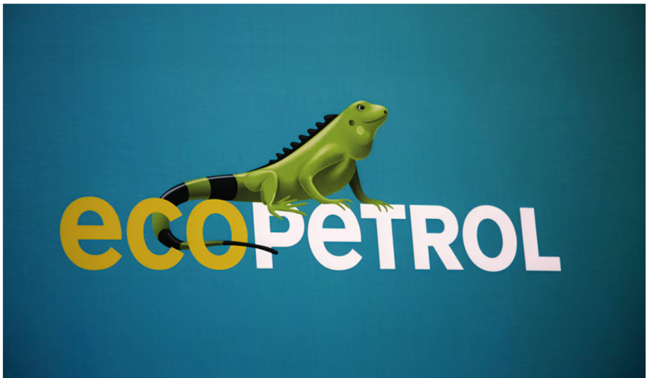
Ecopetrol , envuelta en nueva polémica.

Ecopetrol es una de las empresas más importantes del país y que se ha consolidado también como una petrolera de gran importancia en Latinoamérica. Representa una parte significativa de los ingresos fiscales del país y del Producto Interno Bruto (PIB), al ser el principal productor de petróleo y gas.