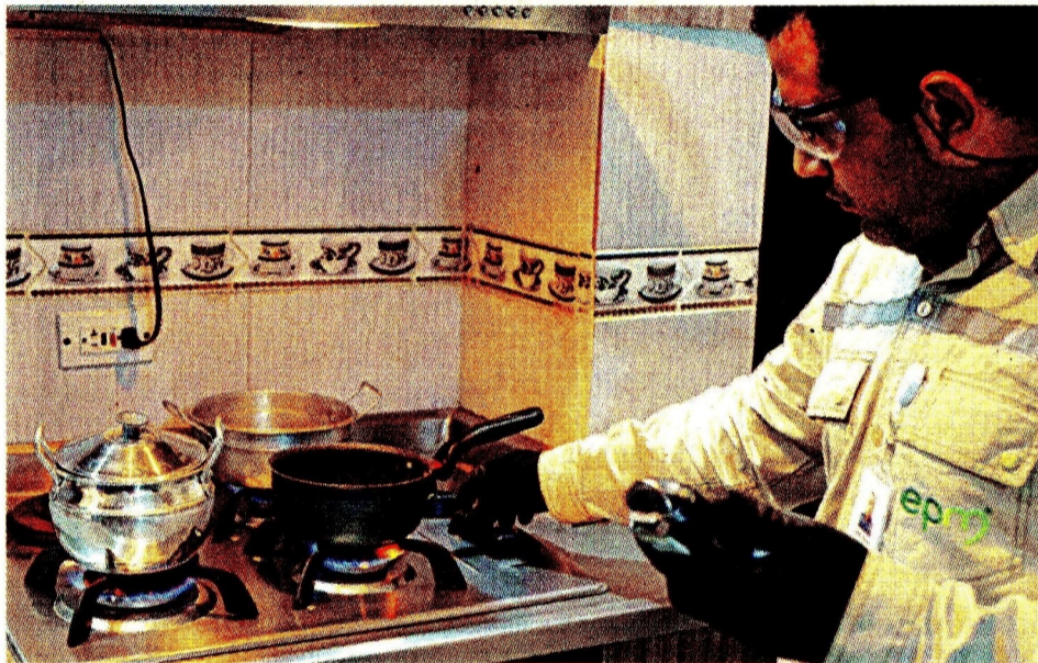
Colombia podría verse abocada a una crisis en el suministro de gas a mediano plazo.