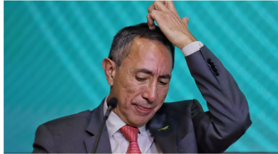
La calificación de Ecopetrol refleja un "fuerte vínculo con el Gobierno colombiano", que es el accionista mayoritario de la compañía. Camila Díaz - RCN Radio

Publicado: Lunes, Marzo 17, 2025 - 11:49 | Actualizado: Lunes, Marzo 17, 2025 - 13:01