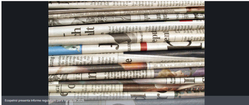
Ecopetrol presenta informe regulatorio para marzo de 2025