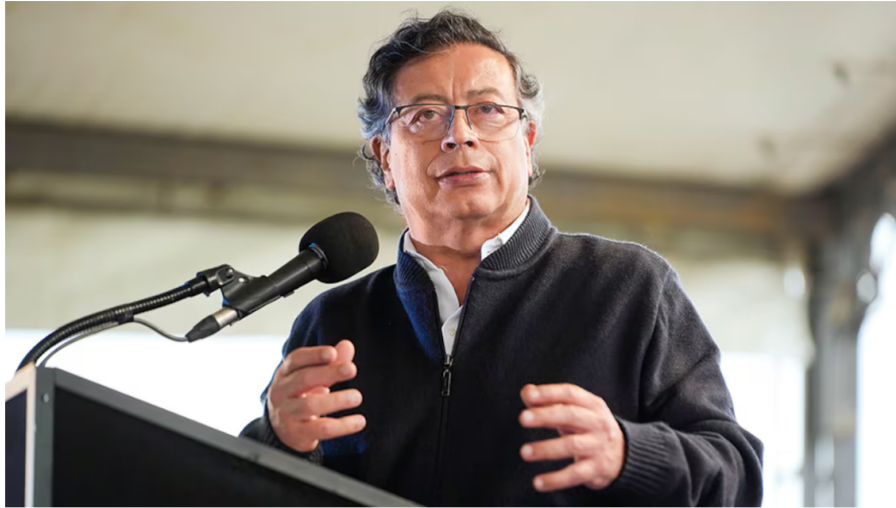
Presidente Gustavo Petro

Ante los mensajes de advertencia que se han lanzado sobre un escenario de incertidumbre en el abastecimiento de gas en Colombia, el presidente de la República, Gustavo Petro, lanzó un mensaje.