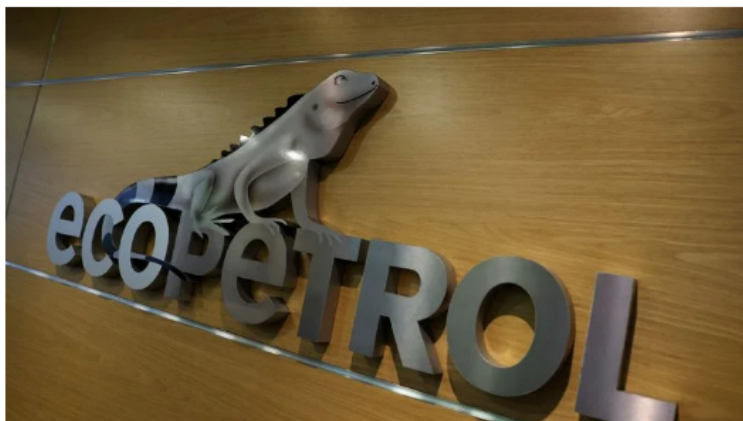
FOTO DE ARCHIVO. El logo del grupo energético colombiano Ecopetrol en su sede en Bogotá

La petrolera estatal brasileña Petrobras y la colombiana Ecopetrol podrían tener las licencias para su proyecto conjunto Bloque Tayrona en el Mar Caribe a mediados del 2026, dijo el jueves el presidente del regulador de hidrocarburos de Colombia, Orlando Velandia.