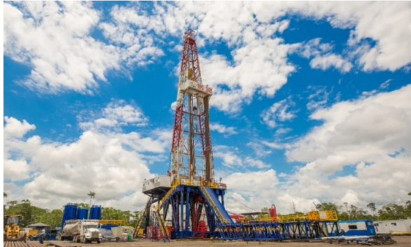
Además del consorcio Sinopetrol, están interesadas empresas de Arabia Saudita, Kuwait y Emiratos Árabes.

Petroecuador seguirá administrando el Campo Sacha y las inversiones para sostener su producción crecerán. Esa es la primera decisión que tomó el Gobierno después de que fracasó el acuerdo con Sinopetrol para entregarle el campo por los próximos 20 años.