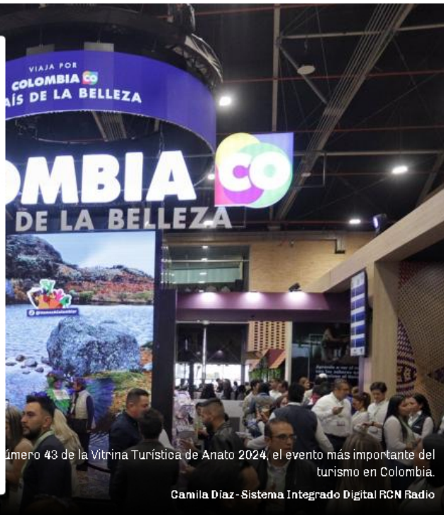
Numero 43 de la Vitrina Turística de Anato 2024, el evento más importante del turismo en Colombia.

Camila Díaz - Sistema Integrado Digital RCN Radio