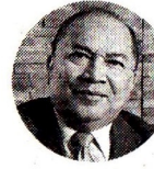
Amylkar Acosta Exministro de Minas y Energía

“El Gobierno no ha desembolsado desde julio de 2024 los montos asignados a los subsidios para el consumo del GLP en cilindros. La deuda por este concepto asciende a $68.000 millones”.