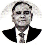
Alejandro Martínez Villegas Presidente de Gasnova

ENERGÍA. GASNOVA ALERTÓ QUE DURANTE EL SEGUNDO SEMESTRE DE 2024 NO SE GIRARON LOS RECURSOS Y LA DEUDA HASTA EL 31 DE DICIEMBRE DEL AÑO PASADO ASCIENDE A $68.000 MILLONES