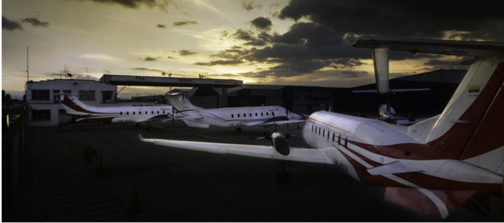
Imagen de aeronaves de la empresa.