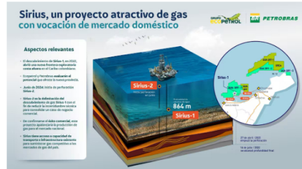
Zona gasífera donde están los pozos Sirius, en aguas profundas frente a las costas del Magdalena y La Guajira.

"El resultado preliminar refuerza el potencial volumétrico del gas en la región", dijo la estatal en un comunicado. Puede interesarle: Santander se 'rajó' en la ejecución de proyectos de regalías entre julio y septiembre de 2024