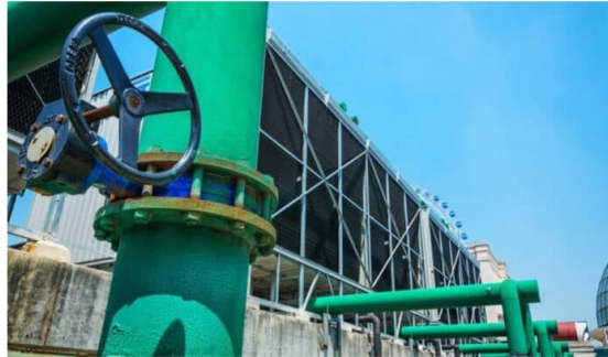
Gas natural en Colombia siguen en alerta.

El presidente Gustavo Petro anunció que Ecopetrol asumirá un nuevo rol en la importación de gas, con el objetivo de regular su precio y frenar lo que calificó como un proceso de 'especulación' en el mercado energético.