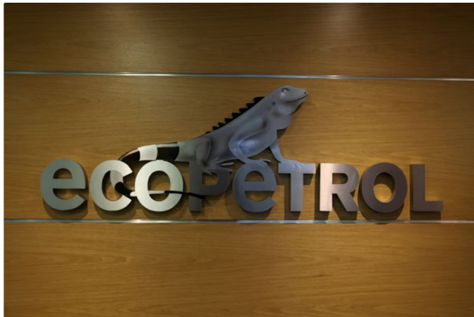
Ecopetrol será la encargada de importar gas desde Catar

Además, en su anuncio, indicó que la Superintendencia de Servicios Públicos debe, "cuanto antes", iniciar las indagaciones para determinar qué empresas de gas están cayendo en la especulación y "sacar" las firmas de acuerdo a la ley, en caso de que no estén comercializando el gas a precios justos. Señalamientos que no cayeron bien en el sector, y que se dieron a conocer justo en el día en que se supo que terminaron con éxito las pruebas en el pozo Sirius: con reservas estimadas de, al menos, 6 terapiés cúbicos, siendo este el hallazgo más importante de la historia del país.