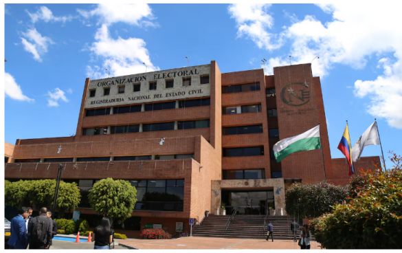
Sede del Consejo Nacional Electoral (CNE).

Además, se le pidió a la Sociedad Aérea de Ibagué (SADI) informes de los vuelos durante la campaña de Petro, para determinar si hubo gastos no reportados.