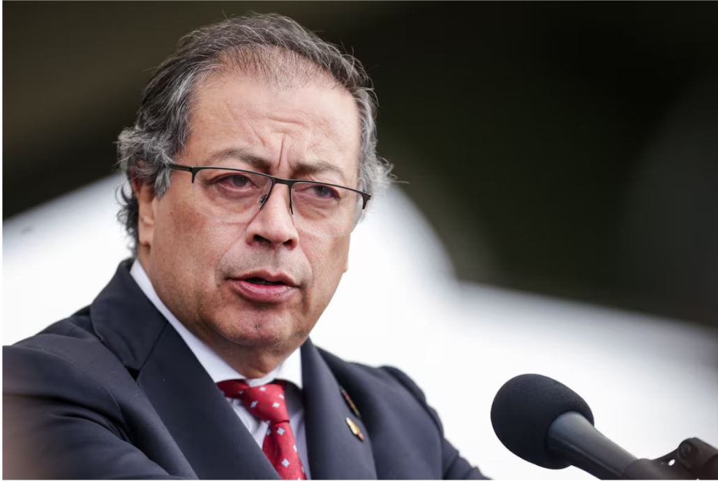
Gustavo Petro, presidente de la República.