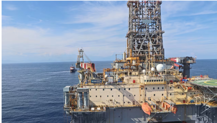
La expectativa de inicio de la producción de gas natural en el pozo Sirius-2 es de tres años.

10 de marzo de 2025 Por: Redacción El País