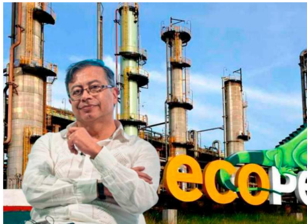
El presidente Gustavo Petro le pide a Ecopetrol traer gas de Oriente Medio.

Justo este lunes la petrolera presentó resultados positivos de pruebas en pozo Sirius-2.