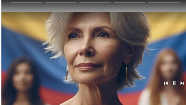
Enlaces Promovidos por Taboola

Además, se le pidió a Caracol Televisión copias de las facturas y pormenores de los servicios que prestó a la campaña , teniendo en cuenta que la campaña pago por publicidad electoral alrededor de $367 millones ; sin embargo, ese pago no fue reportado a las cuentas de la campaña, pero en el expediente sí se encuentra el documento con la factura de Caracol que efectivamente emitió los segundos del comercial de la campaña en su programación.