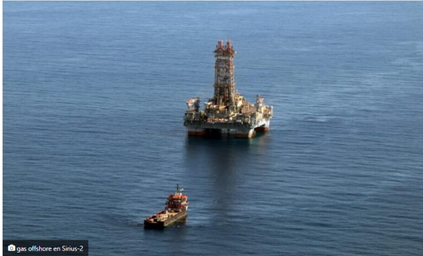
gas offshore en Sirius-2