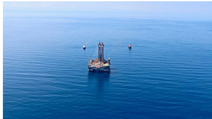
Panorámica de Sirius-2 offshore en el Mar Caribe colombiano.

CORRILLOS hace 1 hora Última actualización: 2025/03/10 at 6:12 PM