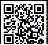
Elon Musk CEO DE TESLA Y X