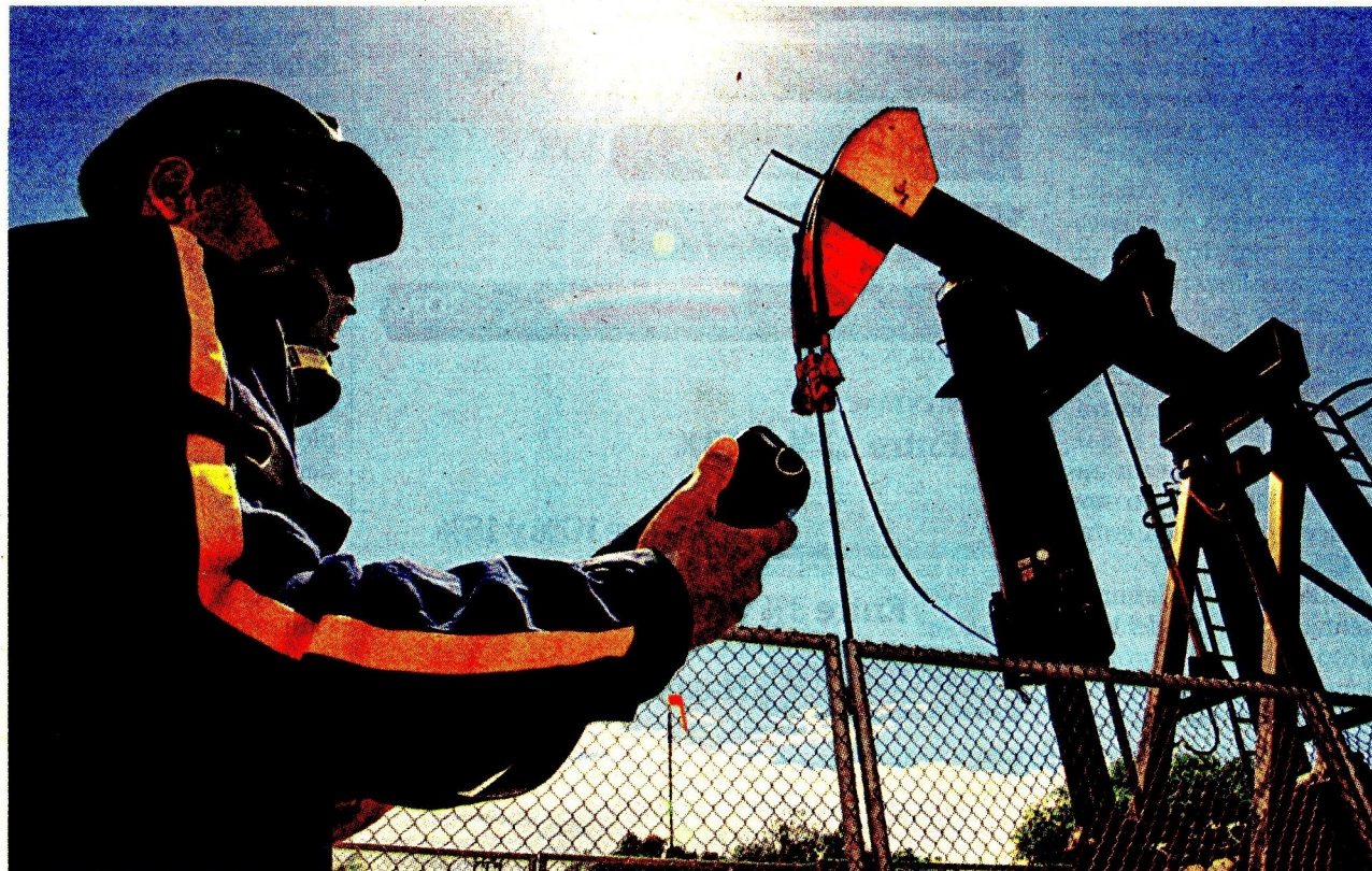
La nueva junta directiva de Ecopetrol tendrá varios retos en materia administrativa, financiera y de producción.

Para expertos como el exministro de Hacienda y ahora rector de la Universidad EIA, José Manuel Restrepo, estos cambios deberán ser contundentes con el fin de que se aprueben decisiones de gran envergadura para el futuro de la compañía.