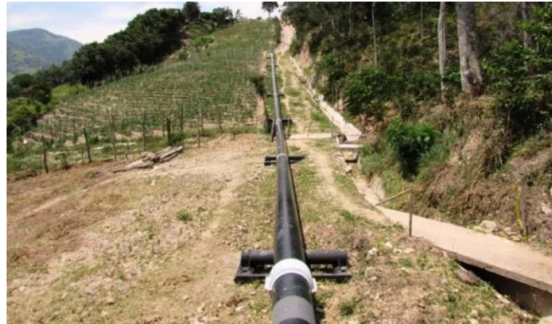
¿Se sigue transportando crudo el Oleoducto Caño Limón-Coveñas? Ecopetrol responde.