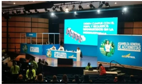
Los ajustes que la Junta Directiva de Ecopetrol propone para el reglamento interno de la Asamblea de Accionistas.

La Junta Directiva de Ecopetrol ha hecho una nueva propuesta para la hacer una modificación al reglamento interno de la Asamblea General de Accionistas. ¿Cuáles son los cambios?