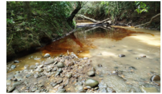
Ecopetrol responde sobre contaminación en La Lizama II marzo 6, 2025

Así mismo fueron informadas las autoridades ambientales como la CAS y la ANLA y el Consejo Municipal de Gestión del Riesgo. También se asignará un equipo por parte de Ecopetrol para determinar las causas que originaron este incidente.