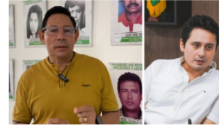
CREDHOS: El Alcalde debe disculparse públicamente marzo 1, 2025