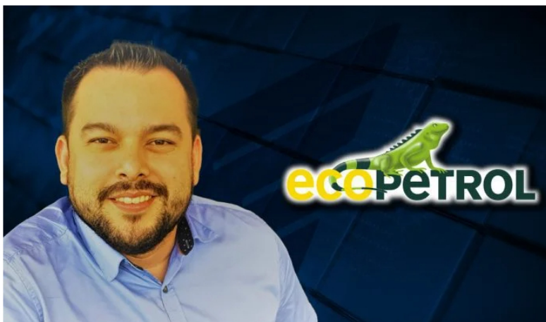
El nuevo ministro de Minas, Edwin Palma, ya renunció a su puesto en la Junta Directiva de Ecopetrol.

En la noche del 5 de marzo de 2025, Ecopetrol informó que se ha concretado la renuncia voluntaria de Edwin Palma Egea, quien era miembro de su Junta Directiva, tras ser designado por el presidente, Gustavo Petro, como nuevo ministro de Minas y Energía de Colombia.