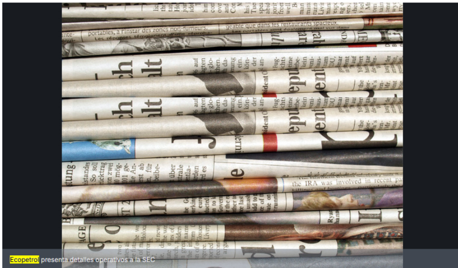
Ecopetrol presenta detalles operativos a la SEC