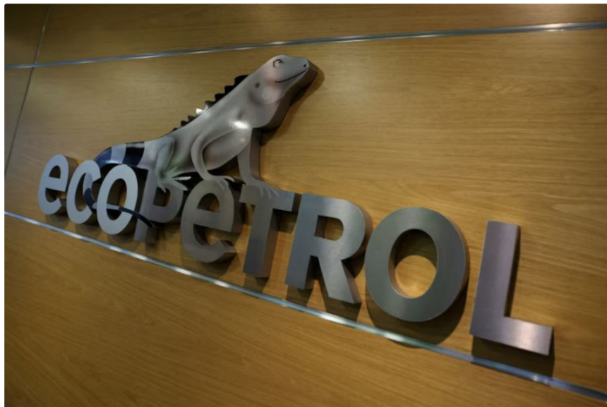
Ecopetrol generó $40 billones en transferencias al país en 2024, representando el 2,9% del PIB

Ecopetrol , la principal empresa petrolera de Colombia, aportó $40 billones a las arcas públicas durante 2024, cifra que equivale al 2,9% del Producto Interno Bruto (PIB) del país.