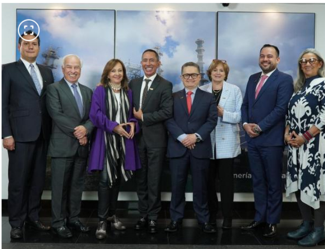
Miembros actuales de la junta directiva de Ecopetrol .

Conozca en detalle las importaciones de gas que hará Ecopetrol por Buenaventura y La Guajira: ¿subirá el precio?